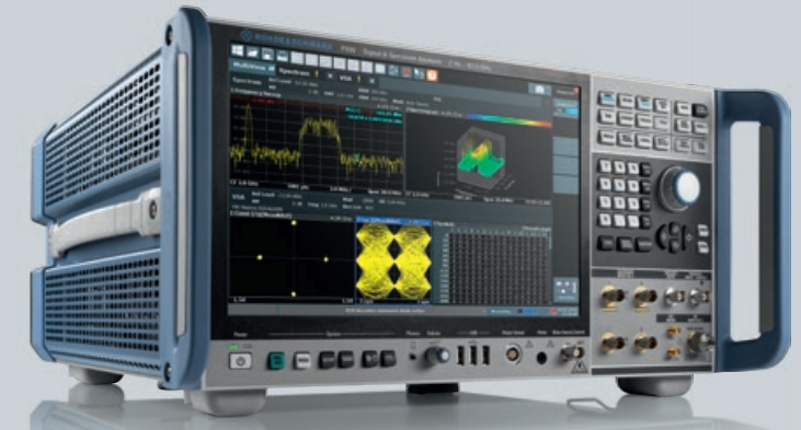
Figure 2 The R&S FSW signal and spectrum analyzer

Tutti i modelli di R & S FSW da 26 GHz e oltre supportano l'analisi interna su un intervallo di fino a 2 GHz di larghezza di banda, mentre i modelli da 43 GHz e frequenze più alte offrono una larghezza di banda interna di 8,3 GHz per questa applicazione. Le opzioni di memoria interna arrivano fino ad un rateo di 24 Gsample / secondo, rendendo possibile acquisire per diversi secondi con una larghezza di banda di 1 GHz. Se sono necessarie sequenze ancora più lunghe, i segnali con larghezze di banda fino a 512 MHz possono essere trasmessi in streaming sull'interfaccia I / Q ed è possibile registrare fino a 40 minuti, ad esempio impiegando il registratore di dati I / Q a banda larga R & S IQW. Con larghezze di banda inferiori, le sequenze registrate possono essere significativamente più lunghe. Gli utenti possono misurare scenari reali sul campo e utilizzare un generatore di segnale per popolare un ambiente test realistico durante attività di laboratorio.